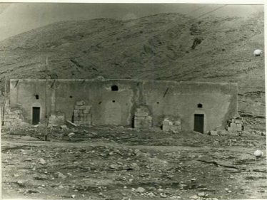
۲۳- بدنه غریب آرامگاه سید امین الدین و بنای پای جزایر سنگی آن