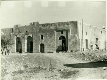
۱۸- نمای ورودیهای آرامگاه از جنبه شمالی .