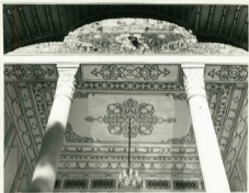
ایوان دولتی مرکزی دایچ اوم