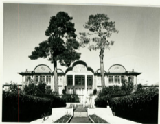
نمای سرخس ساهان و آبنمای جیلر ساهان