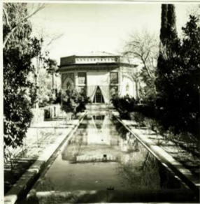
مای آینه‌ای صحنی در محله چارسی