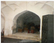
گرمخانه - ضلع جنوبی