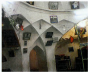
فضای سرپینه حمام پیر غیب