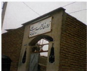
ورودی حمام بزرغیب