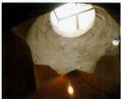
نورگیر در گرمخانه