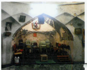
سرینه ضلع شمالی