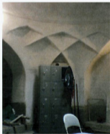
گرمخانه شمال غربی