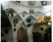
سرینه ضلع جنوبی