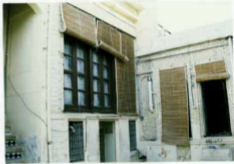
شرح عکس: قسمتی از ضلع شمالی و غربی