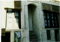
شرح عکس: نمای بیرونی ضلع غربی بنا