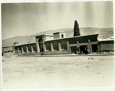
مدرسه سعید در سنجان