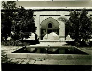
مسجد جامع اصفهان