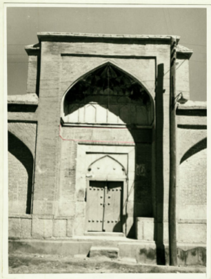
سوره و بهی کتبه د تاج مدرس اصفهان میلند ، بالای سوره ایست .