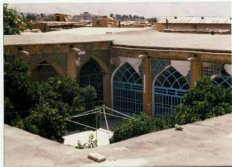
تزیینات گچ و سرامیک آن عمارت در دوره صفویه است