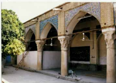
نقوش گچ و سرامیک آن در دوره صفویه است