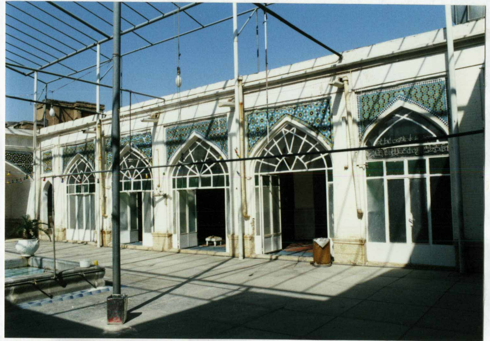
ایوان شرقی مسجد