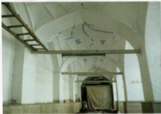
ایوان نور مسجد