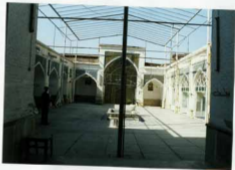
فضای بی میا مسجد همراه سازه چوبی شرف نور