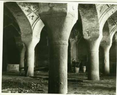
شبهستان شمالی مسجد حاجی میرزا کریم