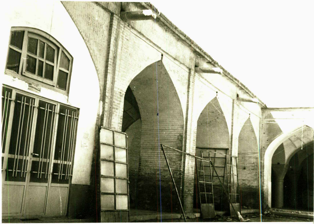
نمای غربی مسجد حاج میرزا کریم