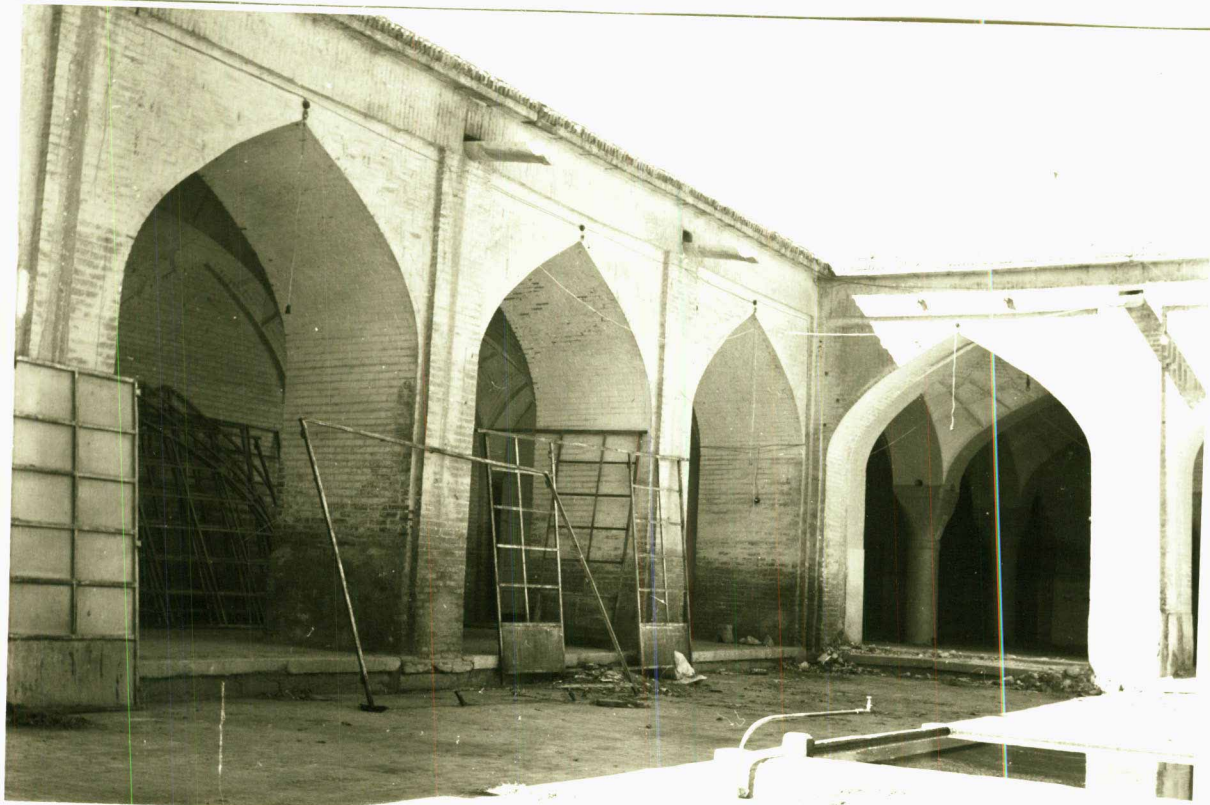
رواق جنوبی مسجد حاج میرزا کریم