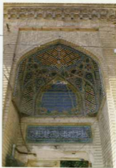
توضیح عکس و موقعیت آن تزئینات آجرکاری و کاشیکاری سردار و رودی مسجد میانه تهران