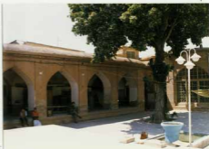
توضیح عکس و موقعیت آن فضای منیع جنبی (شبهستان رستان) در ستورک منطقه غربی