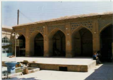
توضیح عکس و موقعیت آن قسمت شمالی مسجد میانه تهران در مسوله پنجشنبه سردار ایوب آباد این ضلع