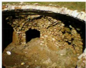
شمال شرقی گرمخانه