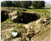
پشت بام حمام