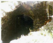
دهاه ورودی حمام