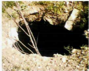
حفره ایجاد شده در سقف حمام