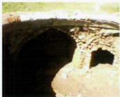
شمال غربی حمام پندز