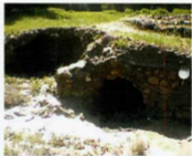
ضلع شمالی حمام پندز