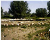
سنگ چینهای سقف حمام