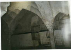
شرح عکس: آقچه‌سقا