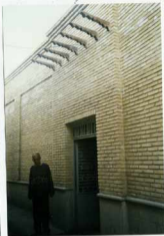
شرح عکس: سر سردار