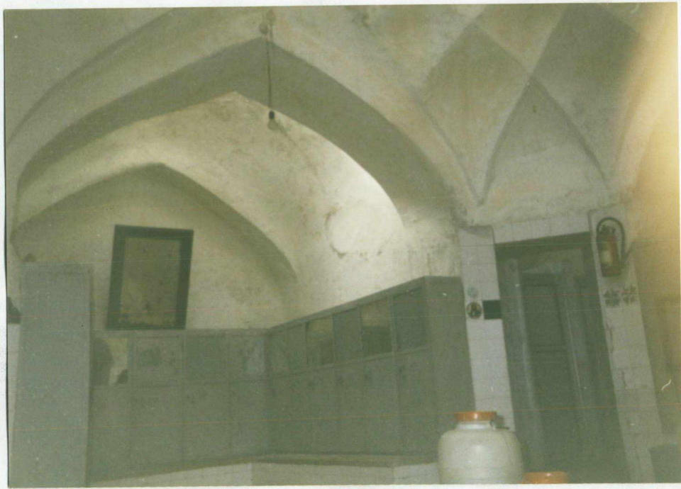
شرح عکس: داخل سرسینه