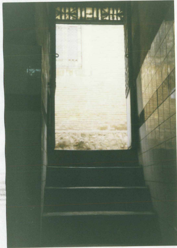
شرح عکس: داخل ورودی