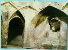
توضیح عکس و سوانح آن