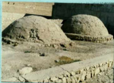
توضیح عکس و موقعیت آن