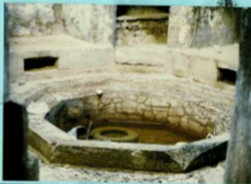
توضیح عکس و سوانح آن حمام خور