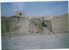
توجه عکس: نمای خارجی حمام قبش خاکبرداری شده