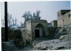
توجه عکس: نمای سبب درون حمام