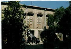
شرح عکس، نمای شمالی