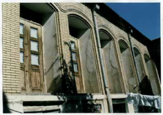
شماره عکس: نمای شمالی بنا