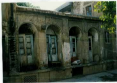
شماره عکس: پنج دروازه در سمت شرقی