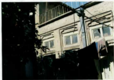
شماره عکس، نمای شمالی بنا