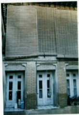
شماره عکس، نمای دیگری از صلیب غربی