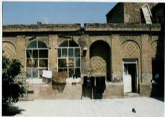
شماره عکس: نمای پروی صنایع عربی