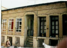
شماره عکس: نمای پروی صنایع شمالی

سازمان اسناد و کتابخانه ملی جمهوری اسلامی ایران