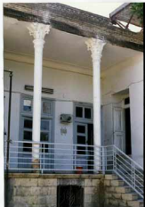
شماره عکس: ایوانه دستورنوار بنا