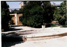
شماره عکس: قسمتی از حیاط و حوض آن