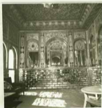
پیتربخاری مشزل اوچی