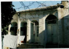
شماره عکس: نمای بیرونی منیع شاهی