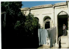
شماره عکس: نمای بیرونی منیع عمری