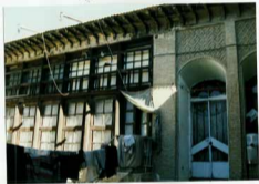
شماره عکس: نمای پرده‌ای صانع جنوبی