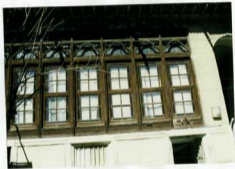
شماره عکس: نمای کلی صانع غربی