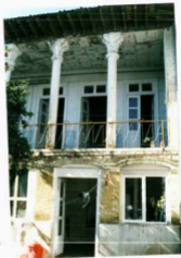
شرح عکس: ایوان مستطیل ضلع غربی