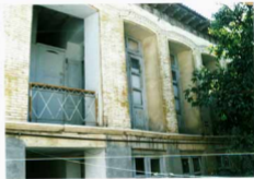
شماره عکس: چینه شمالی