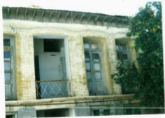
شرح عکس: ضلع شمالی بنا