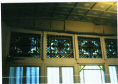
شماره عکس: حریرات داخلی بالا شمالی