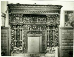
درگهای تالار اصلی و یکی از پیش‌بخارهای منزل شوریده ترکینات