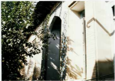
شماره عکس: نمای بیرونی منبع غریبی (میراد کوچه)