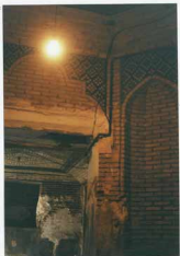
شماره عکس: آینه‌نمای داخلی اتاق موزه‌ای قلع چذایی