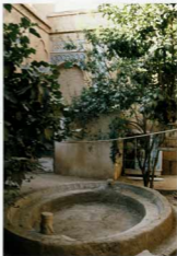
شماره عکس: بخش (از حیاط کوچه منبع غریبی)