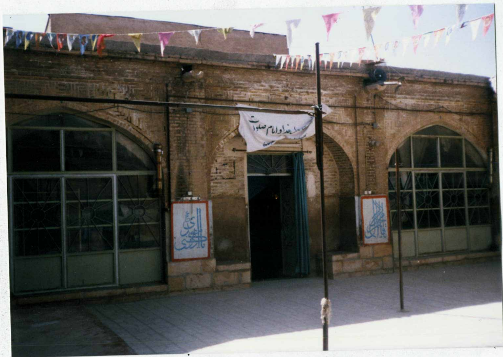
شرح عکس: ضلع جنوبی