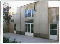
مسجد جامع چنار ، نمای بیرونی ضلع جنوبی