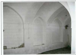
مسجد جامع چنار ، فضای داخلی شبستان