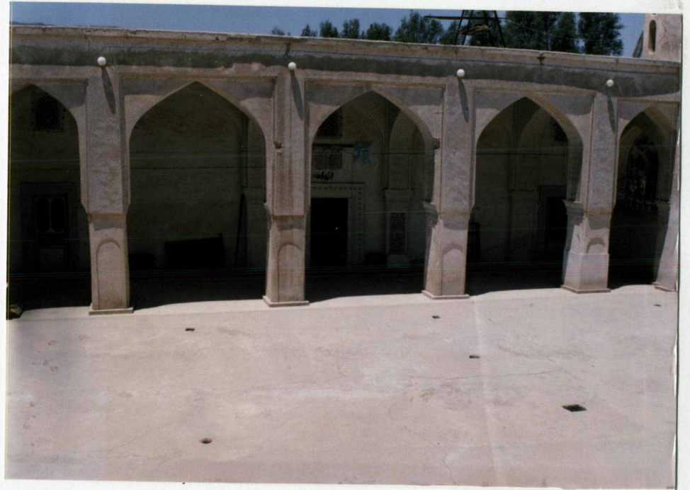
توضیح عکس وموقعیت آن نمای شمالی مسجد جامع اشکنان